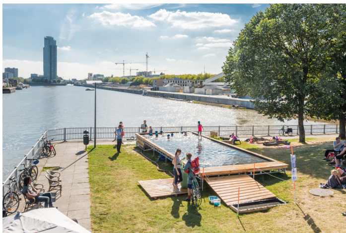
Badeau, Laeken, 2016, by Pool is Cool in coll. with Au bord de l'Eau

Entre 2016 et 2019, l'actualité en Belgique et en Europe a été marquée par des attentats terroristes, une intensification des phénomènes migratoires, des mouvements sociaux bouleversants, un système démocratique en question, des signaux forts d'alerte climatique, une extension de lieux sans âmes... Une sensation diffuse de crise a envahi les médias, les réseaux sociaux, les relations humaines.